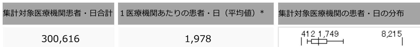
集計対象医療機関の解析対象患者の患者・日分布 (N=152)