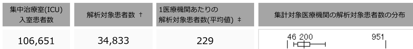
集計対象医療機関の解析対象患者数の分布 (N=152)